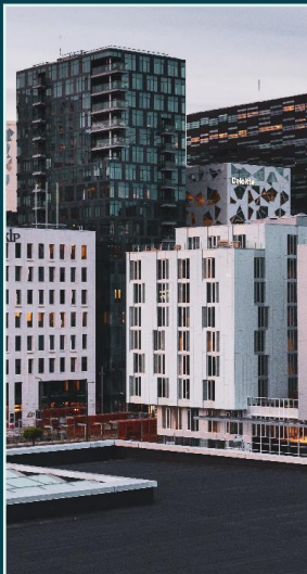
Fjernvarme Kjøling Karbonfangst