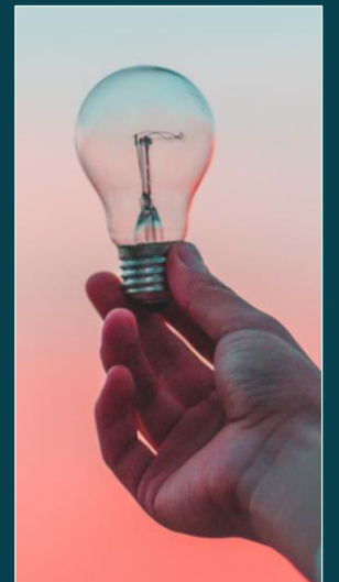
Nye energi- løsninger