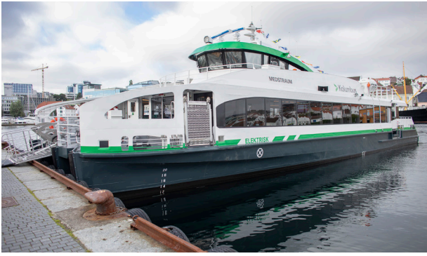
Vinner av Årets lokale klimatil­tak 2022: Rogaland fylkeskommune for verdens første elektriske hurtigbåt, Medstraum.